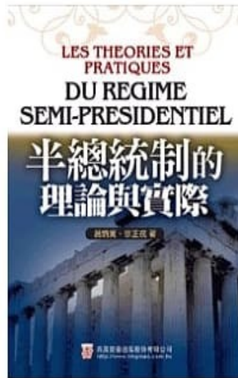
憲法理論專書著作